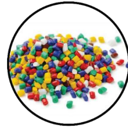
PPS 3 Materiais POLIMÉRICOS