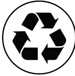
PPS 5 Desafios ECONÔMICOS, SOCIETAIS e AMBIENTAIS