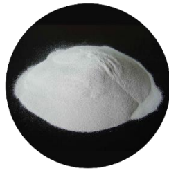
PPS 2 Materiais CERÂMICOS e CIMENTÍCIOS