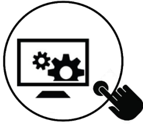
PPS 4 Metodologias e Sistemas DIGITAIS