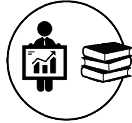
PPS 6 GESTÃO do Projeto e DISSEMINAÇÃO Técnico-Científica